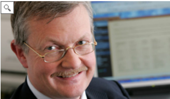
Ulrich von Jeinsen